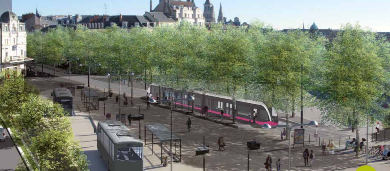
Hypothèse d'aménagement de la place Darcy et du Parvis de la gare de Dijon Ville, en 2012.