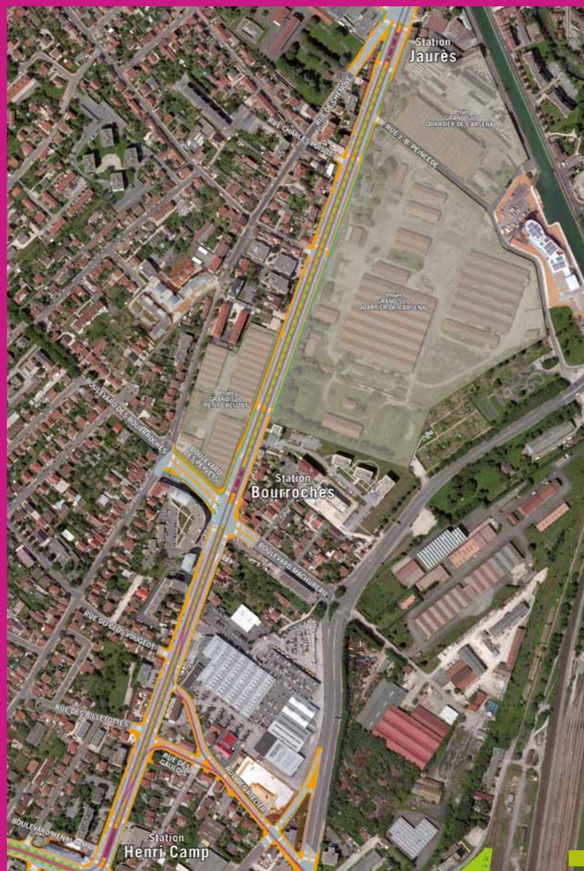
Insertion du tramway sur l'avenue Jean Jaurès (projet au 31/07/2010)