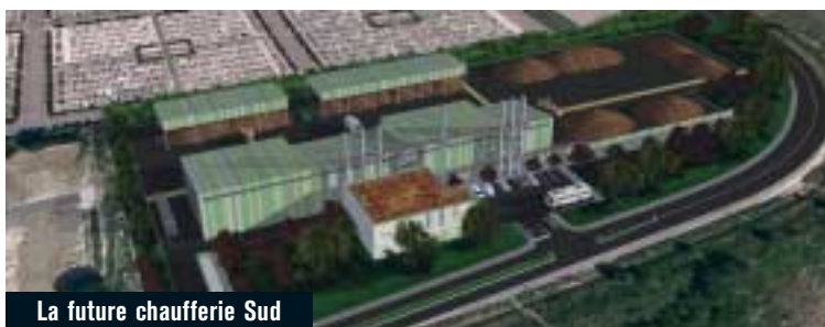
La future chaufferie Sud