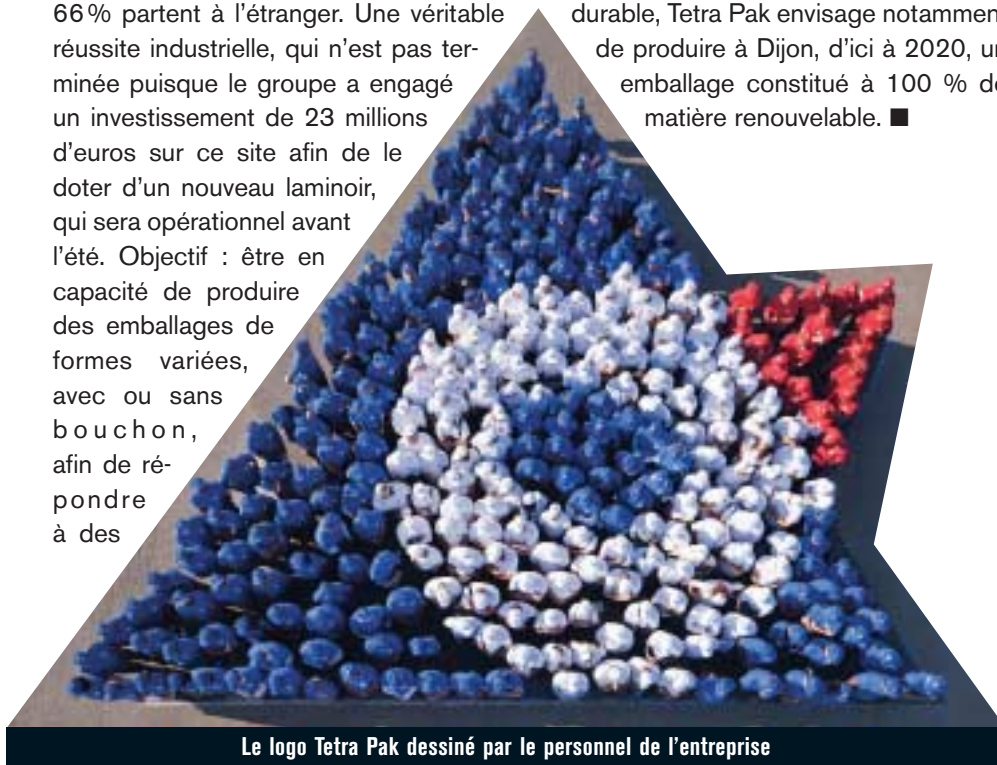
Le logo Tetra Pak dessiné par le personnel de l'entreprise

demandes de plus en plus pointues des industriels de l'agroalimentaire. Cet investissement doit aussi permettre à Tetra Pak de préserver son leadership sur un marché où l'emballage plastique, bien que davantage polluant, gagne des parts de marché sur l'emballage carton, spécialité du groupe suédois. Pour renforcer sa politique en faveur du développement durable, Tetra Pak envisage notamment de produire à Dijon, d'ici à 2020, un emballage constitué à 100 % de matière renouvelable. ■