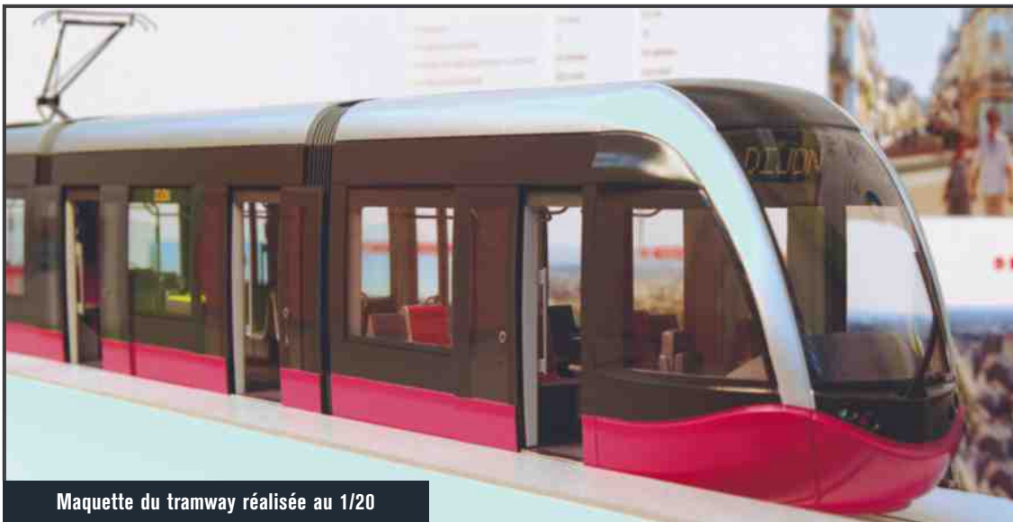
Maquette du tramway réalisée au 1/20

Le système « tram-train » est relativement courant en Allemagne ou dans les pays scandinaves, mais pas encore en France, où il n'en existe qu'un seul, à Sarreguemines (réseau de tram de Sarrebourg). Mulhouse, Nantes et Strasbourg prévoient de se doter d'un tram-train. Dijon n'en est pas encore là, mais le réseau tel qu'il est conçu permettra, à terme, une connexion avec le réseau SNCF. Les deux lignes dijonnaises, qui desservent toutes deux la gare Dijon-Ville, passent d'ailleurs au plus près des voies ferrées. Le conseil régional de Bourgogne, en s'engageant financièrement dans le projet, a d'ailleurs évoqué clairement la perspective de connecter ensemble le TER et le tramway. On pourrait alors, pourquoi pas, se rendre de Beaune au campus de Dijon sans descendre de la rame !